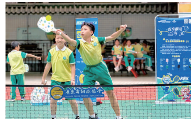
广州十六中学生挥拍匹克球。

22日,广州十六中;23日,越秀区豪贤路小学……两天,两所学校,100多名孩子第一次拿起匹克球拍——从中学到小学,凯瑞麟和GPCC(粤港澳大湾区匹克球城市挑战赛)的公益脚步,在大湾区校园里加速奔跑。