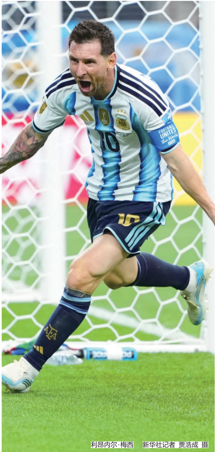
利昂内尔·梅西

A组的墨西哥队以6积分排名第一,提前锁定晋级名额。韩国队以3积分排名第二,捷克队、南非队均取得1积分。尽管韩国队掌握出线主动权,但捷克队与南非队同样有出线的机会,因此本轮比赛势必激烈。