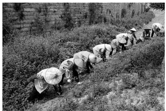
摄影作品：《最美劳动者》 作者：丁秀英（女，1952年生）