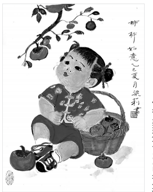
工笔画作品：《柿柿如意》 作者：梁利（女，1962年生）