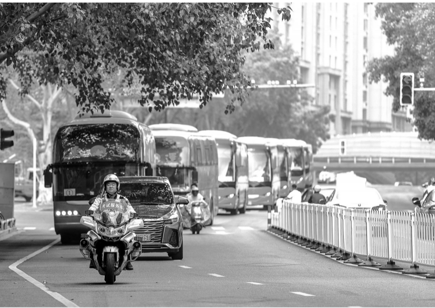
晋江交警暖心护航高考,及时发现和处置各类突发状况。

同日上午,晋江二中考点也发生了类似突发情况。一名考生到了考场门口才发现准考证忘在了家里,顿时慌了神。带队老师一边安抚考生,一边迅速向现场执勤的晋江市公安局交通管理大队民警求助。时间紧迫,距离考试开始已所剩不多。交警铁骑队员立即发动摩托车,载上老师赶去取准考证。一路上,铁骑争分夺秒。最终,在开考前将准考证顺利送到考点入口,考生及时进场参加考试。