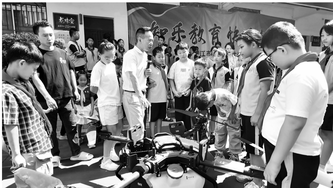
仕头小学举行无人机观摩活动。

本报讯(记者 王焜火)昨日,晋江市西园街道党工委、西园街道办事处、西园街道公益慈善协会联合开展“六一”儿童节走访慰问活动。