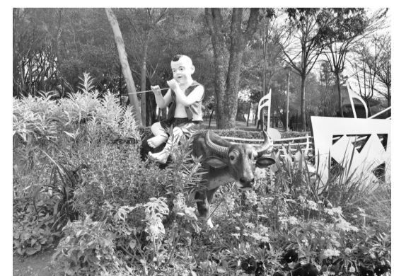
摄影作品：《花间牧童》 作者：蔡榕（女，1957年生）