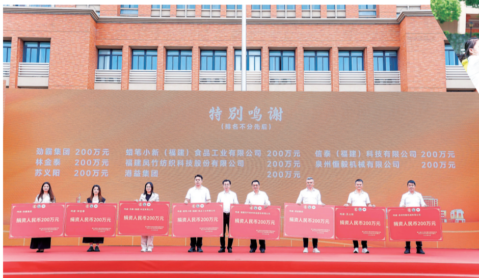
爱心企业、企业家踊跃捐资支持教育。

而随着高中教育“拼图”的填补，开发区将形成从幼儿园到高中、从普教到职教、从学历教育到技能培训的全方位教育体系，为产业升级提供更加坚实的人才支撑。