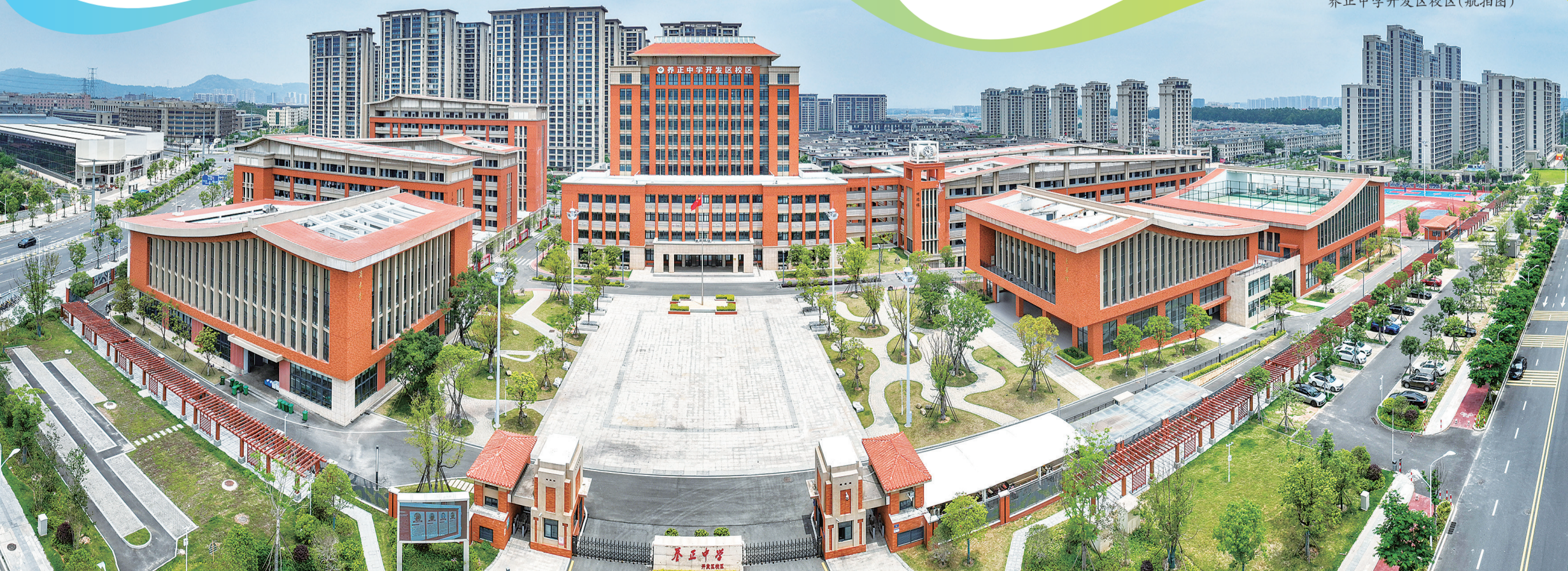
养正中学开发区校区(航拍图)