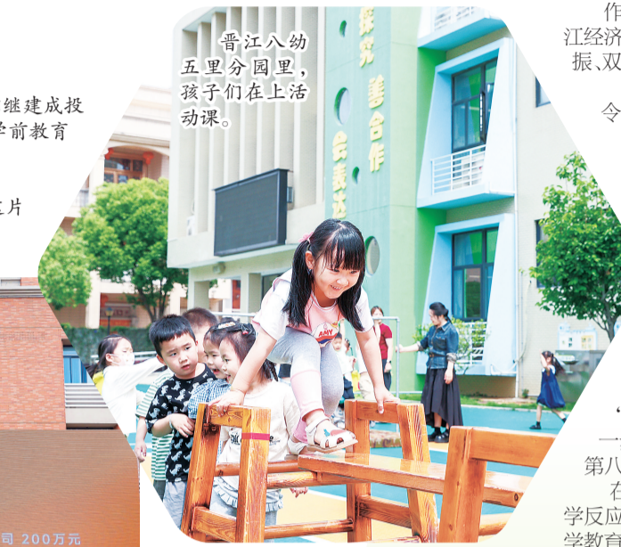
晋江八幼五里分园里，孩子们在上生活课。