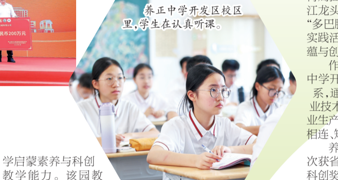
养正中学开发区校区里，学生在认真听课。