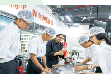
安海职校经开区校区面点专业实操课堂

“教育是开发区高质量发展的根基工程、民生工程、竞争力工程。”晋江经济开发区管委会相关负责人表示，下一步，晋江经济开发区将继续坚持“产业立区、教育强区、人才兴区”战略，以更高站位、更宽视野、更实举措，全力护航园区教育事业高质量发展，营造尊师重教、兴教强区的浓厚氛围，推动教育事业再上新台阶。