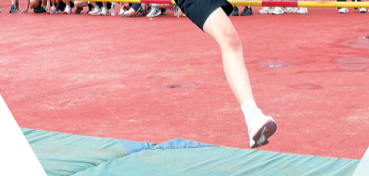
晋江八小学子在运动会上快乐运动。

以晋江经济开发区教育发展促进会第二届理事会成立暨养正中学开发区校区首届董事会成立为契机，安踏公司设立“教育教学专项基金”，开发区商会设立“教研科研专项基金”。政企校社协同育人强教格局的形成，为开发区优质教育注入更强“活水”。