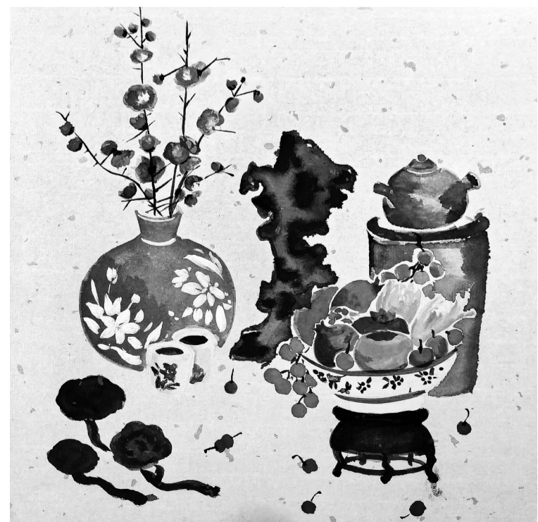
关辰磊（晋江安海养正中心小学六年9班） 指导老师 许雅霜