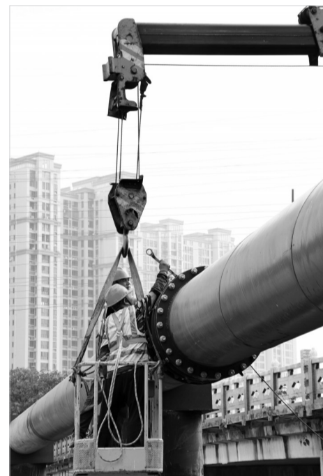
摄影作品：《劳动者》 作者：邱华复(男,1950年生)