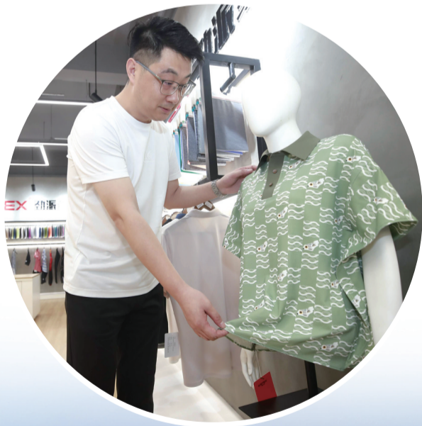
劲派经编面料展厅

聚力数智，以“新”提质。下一步，英林镇将持续落实“企业家+科学家”融合创新工作，以链主改造牵引全链条数字化、绿色化、融合化提升，做优柴牌、劲派“5G+智慧工厂”，引导上下游企业加快数字化转型，以“新”提质，健全纺织服装产业“链主+骨干+新锐”梯度培育机制，推动更多企业上榜省级龙头企业、泉州市民营企业100强、晋江市民营企业综合实力100强榜单，新增一批“小升规”企业；抓好细分领域头部企业挖潜增效，鼓励大中小企业上下游协作、融通发展，培育重点产业链“链主”企业。同时，以英林园大健康产业园为载体，引进食品行业龙头企业，加快推进力诚、奇峰等项目，培育健康食品产业赛道。