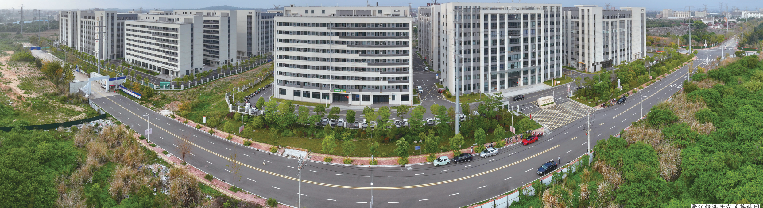
晋江经济开发区英林园