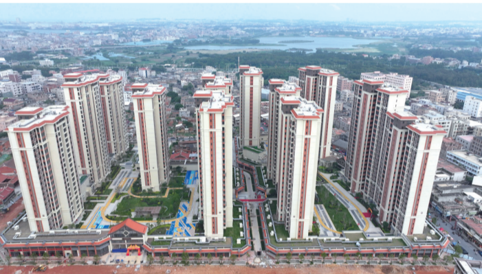
英林村旧村改造(一期)项目安置房

如今，作为泉州南翼国家高新区的重要节点城镇，英林镇镇域面积不足30平方公里，分布着服装加工、纺织化纤及其他服装相关企业超千家，产值超300亿元，其中泳装、瑜伽服等贴身运动服饰相关产业年产值超过200亿元。在这里，既聚集了恒逸集团等龙头为牵引的上下游企业，中游的面料、辅料生产企业，更有下游的成衣制造、销售企业，从一根丝到一件衣服，形成上中下游产业闭环，本地企业30分钟内即可完成泳装上下游的链接。