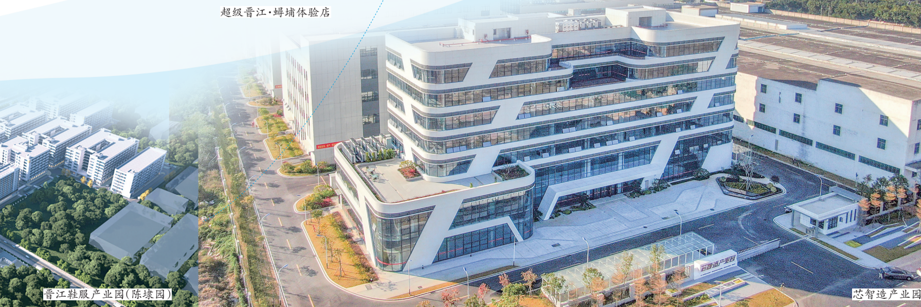
晋江鞋服产业园（陈埭园）

初心如磐向未来，笃行致远启新程。下一阶段，晋江产业集团将以更实举措推进各项工作走深走实。坚持党建引领强根基，持续擦亮“领头羊”党建品牌，推动党建与业务深度融合，建强人才队伍，为高质量发展筑牢坚实政治保障。聚焦产业投资主业，统筹推进100项“123”争先进位工作和147个重点项目，构建多元资本矩阵，重点布局硬科技投资，强化基金招商，持续赋能产业生态升级。夯实产业载体支撑，加快现代产业社区及百亿级配套项目建设，高效运营科创飞地，深化产学研协同创新，升级供应链与海外仓布局。坚守民生初心，稳定供水、能源等基础保障，有序推进绿色能源、渔港建设及乡村振兴项目落地，不断增强民生福祉。深化改革提质增效，持续推进市场化运营，拓宽多元融资渠道，健全风险防控体系，稳步做强做优做大，为集团高质量发展蓄势赋能、保驾护航。