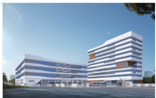
英麦科半导体产业园

乡村振兴纵深推进，民生担当彰显本色。晋江产业集团积极践行国企社会责任，助力乡村全面振兴，加快海洋渔业转型升级，完成全市首个深远海养殖项目，参与东石白沙二级渔港项目、金井围头一级渔港项目及陆域配套项目等工程建设，助力推动晋江市打造海洋经济发展示范区。推进大盈溪“一县一溪一特色”田园风光综合体建设，构筑特色鲜明的田园文旅景观体系。创新EOD项目模式建设滨海乡村振兴示范带，完成全市首个土地综合整治项目建设及耕地指标入库，建设全省首个全市统一的林地指标储备库与交易平台，2025年交易额突破2900万元；发行全市首张“福林票”，推动生态产品价值实现“破冰”。坚持“公益+效益”，统筹抓好供水、粮食、医药、肉品等重要民生商品供应，控股的福建省晋江自来水股份有限公司年均供水量超1亿吨，启动全市肉品加工厂项目建设，保障市民的“水缸子”“菜篮子”“米袋子”“果盘子”“肉案子”。