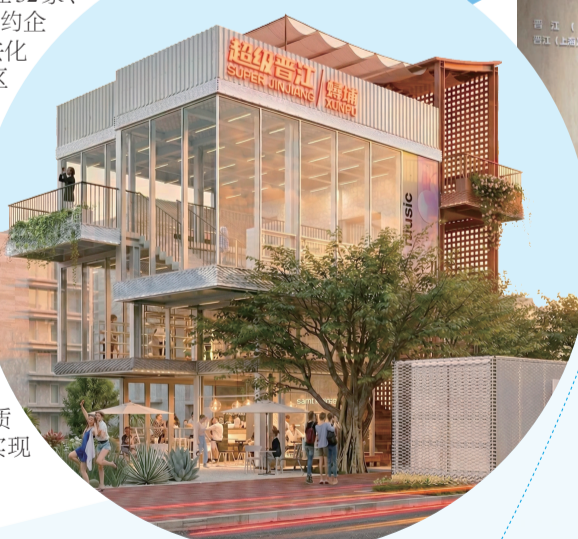
超级晋江·坪埔体验馆

园区飞地双向发力，引才引智同步推进。晋江产业集团做实园区招商，芯智造产业园一期入驻企业32家、21家实现投产，年新增签约企业13家、扩租2家，招商去化率同比提升21.24%，园区产业集聚效应持续凸显。做优飞地招商，深圳湾区三创中心高效运营，引进博士17人、硕士2人，入驻率超90%，累计来晋纳税超500万元，带动密芯、北朋等4个项目产业化落地；晋江（上海）离岸创新中心正式揭牌运营，打破地域局限，搭建起高端人才引育、优质项目招引的前沿阵地，实现“项目+人才”双招双引。