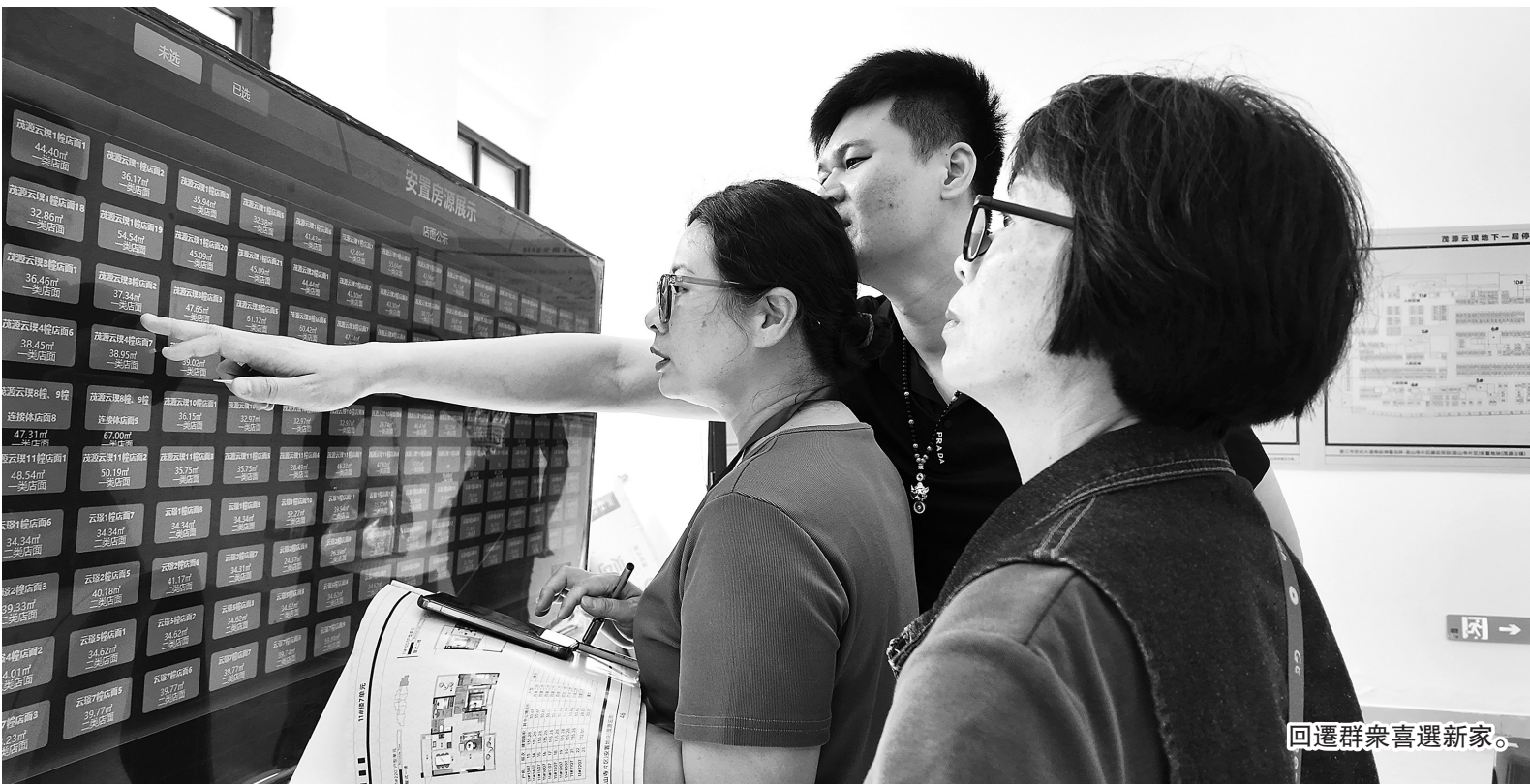
回遷群眾喜選新家。

本報訊（記者 林伊婷 歐陽星）10日下午，晉江市世紀大道南延伸暨北環一龍山寺片區建設項目（龍山寺片區）選房工作正式拉開序幕。 下午2時許，龍山寺片區選房服務中心門前已是人聲鼎沸，首批選房的回遷群眾帶著對新家的憧憬早早來到現場。 現場，佩戴醒目工作牌的工作