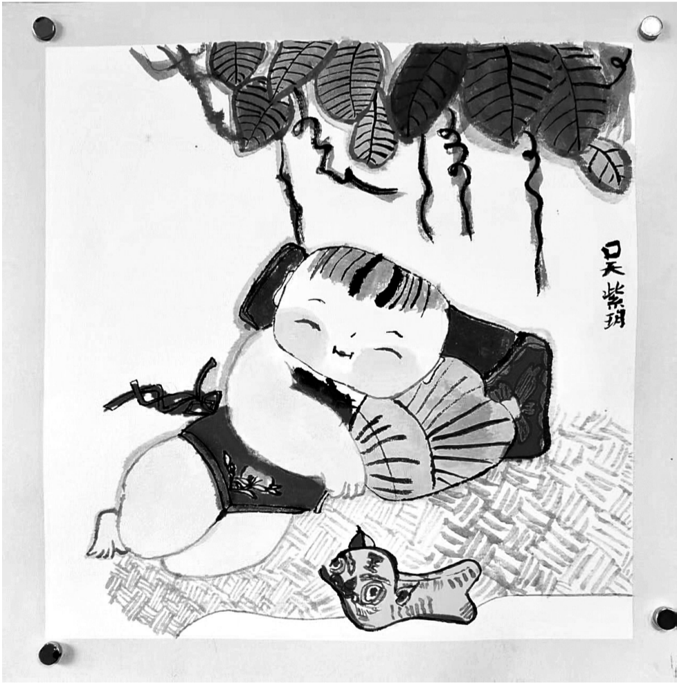
吴紫玥(晋江安海成功中心小学四年1班) 指导老师 苏燕燕