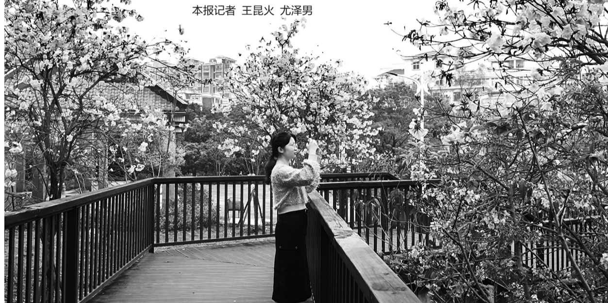
本报记者 王昆火 涂泽勇

昨日,晋江市英林镇长存公园游人如织——有的走进图书馆静心阅读,有的在公园踏青赏樱,还有的在足球场上挥洒汗水。春意盎然的书香公园,已成为英林镇群众休闲、运动、读书的好去处。