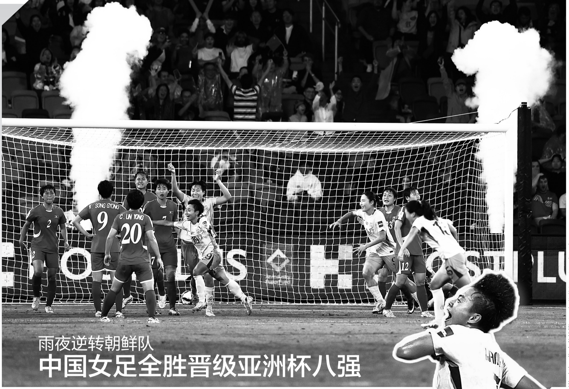
中国足球队在比赛中庆祝进球。

新华社北京3月9日电 当地时间8日,全英羽毛球公开赛在伯明翰落幕,中国队入账两金。王祉怡结束对韩国名将安洗莹的10连败,夺得女单冠军;刘圣书/谭宇欣登顶女双。国羽在这两个项目上都是时隔7年再次夺冠。 女单决赛在头号种子安洗莹和2号种子王祉怡之间展开,这也是去年决赛的重演。彼时安洗莹逆转获胜,此番王祉怡表现得顽强且耐心,最终以21:15、21:19拿下胜利。国羽上一次夺得全英赛女单桂冠还要追溯到2019年,当时陈雨菲笑到最后。 “我仍然不敢相信我能赢,真的很开心。我觉得非常重要的一点是我面对她(安洗莹)的心态。以往的比赛,可能我没有坚持这么多拍,但今天我做到了,而她就出现了失误。这可能是让今天结果不一样的原因。”赛后王祉怡说。 同样取得突破的还有世锦赛冠军刘圣书/谭宇欣。女双决赛中,面对韩国组合白荷娜/李绍希,头号种子刘圣书/谭宇欣以21:18、21:12连下两城,首夺全英赛冠军,并解锁全部超级1000赛冠军。2026年开年以来,她们已连续登顶三站世界羽联超级级别赛事。 中国台北队收获两金。林俊易以21:15、22:20击败印度选手拉克什亚·森,夺得男单;叶宏蔚/詹又蓁以21:19、21:18战胜法国组合吉凯尔/德尔吕,混双折桂。 男双冠军归属韩国组合金元昊/徐承宰,他们鏖战三局,2:1战胜马来西亚组合谢定峰/苏伟译,成功卫冕。