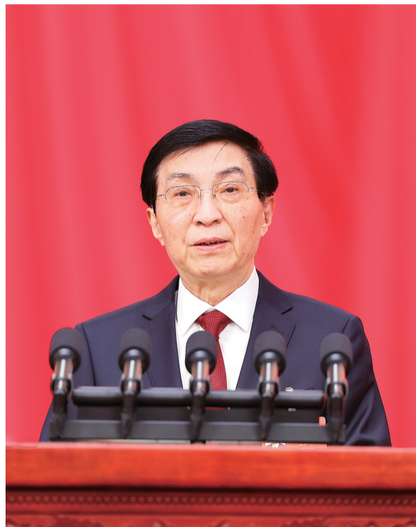
全国政协主席王沪宁代表政协第十四届全国委员会常务委员会,向大会报告工作。

三月的北京,春启华章。人民大会堂大礼堂灯光璀璨,气氛隆重热烈。中国人民政治协商会议会徽悬挂在主席台正中,十面鲜艳的红旗分列两侧。