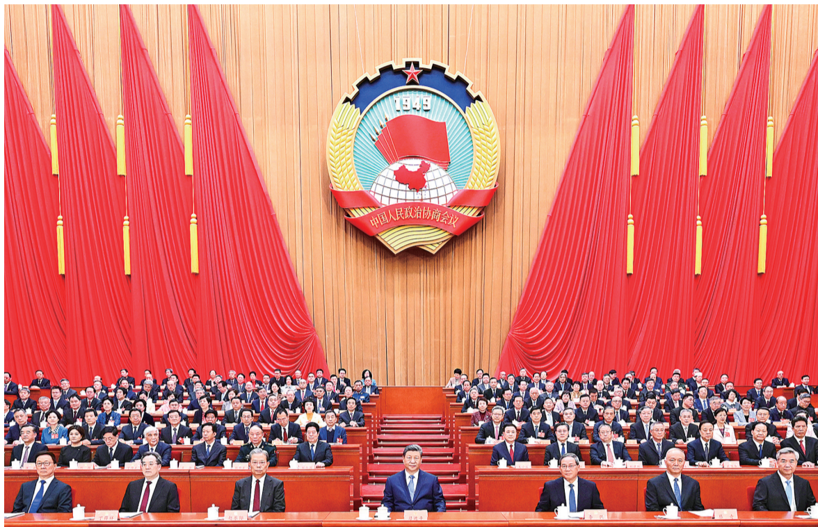
3月4日下午,中国人民政治协商会议第十四届全国委员会第四次会议在北京人民大会堂开幕。这是习近平、李强、赵乐际、蔡奇、丁薛祥、李希、韩正在主席台就座。

新华社北京3月4日电 同心同德共绘宏伟蓝图,实干奋斗共创新时代伟业。中国人民政治协商会议第十四届全国委员会第四次会议4日下午在人民大会堂开幕。2000多名全国政协委员围绕中共中央决策部署,聚焦“十五五”规划纲要制定和实施,深入协商议政、积极建言献策,为“十五五”开好局、起好步广泛凝心聚力,为以中国式现代化全面推进强国建设、民族复兴伟业贡献智慧和力量。