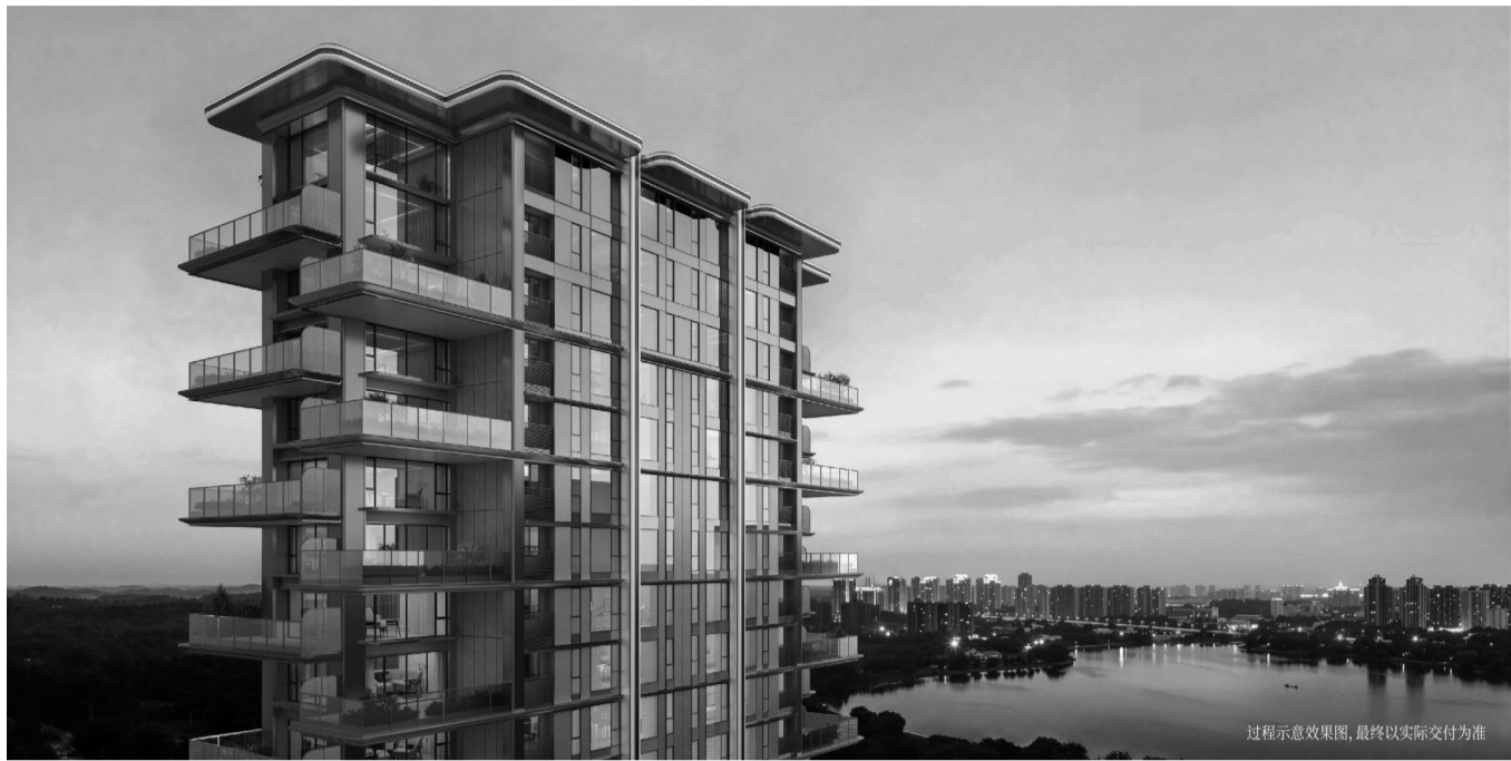
过程示意图，最终以实际交付为准

黄晶涛表示，规划设计立足晋江本土基因，兼顾城市发展与文化传承，通过系统化统筹、精细化营造，让片区既有国际视野，又有闽南温度，为晋江城市更新提供可借鉴的实践样本。