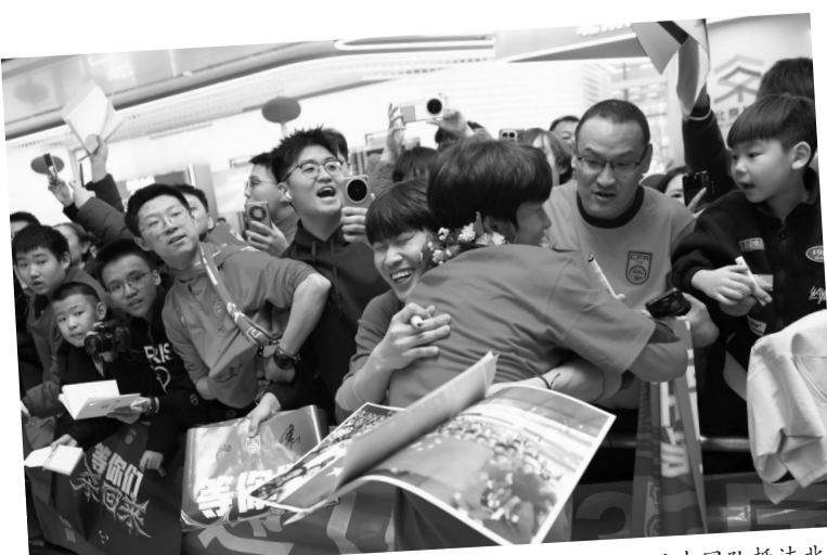
1月26日,在沙特阿拉伯夺得U23男足亚洲杯亚军的中国队抵达北京大兴国际机场,受到球迷的热烈欢迎。

当天活动的全称为“让对手忌惮未来”中国之队U23队员门店分享会。活动现场,三名队员都身穿印有这些字样的T恤亮相。主办方介绍,作为中国足协装备合作伙伴,耐克提出“让对手忌惮未来”中国之队U23队员门店分享会,并向三位球员赠送了三双侧面印有该口号的定制球鞋,希望他们持续成长、不断突破,在未来为中国足球贡献更多力量。