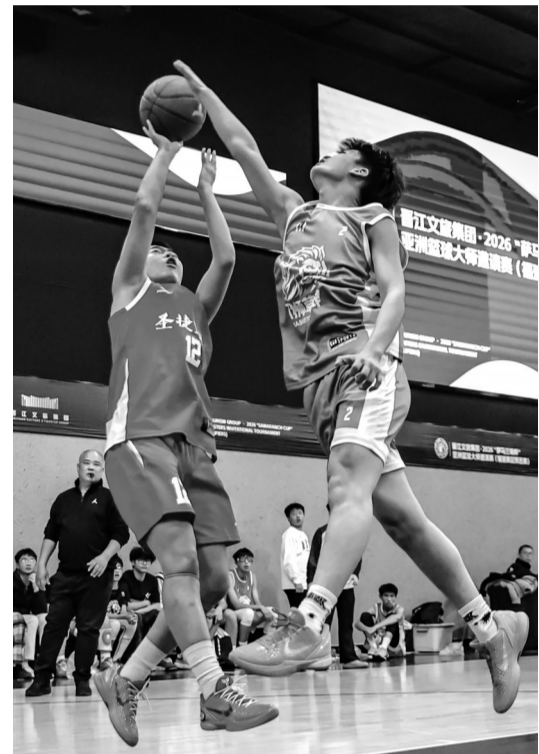
晋江文旅集团·2026“萨马兰奇杯”亚洲篮球大师邀请赛福建赛区选拔赛日前在晋江举行。

作为亚洲大众篮球领域的高水平赛事,本届邀请赛国际化程度高、参与者覆盖面广,赛事吸引104支球队踊跃参与,其中包括越南、马来西亚、泰国及中国香港、中国澳门等地区的20支队伍。