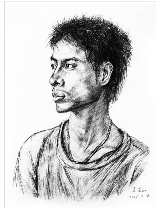
素描作品：《肖像》 作者：王政山(男，1962年生)