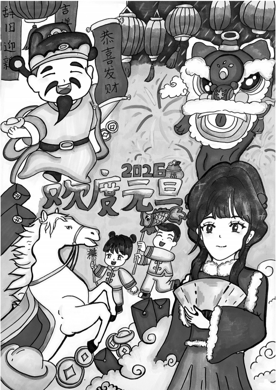
陈梓妍(晋江市安海中心小学五年1班) 指导老师 蔡雪云