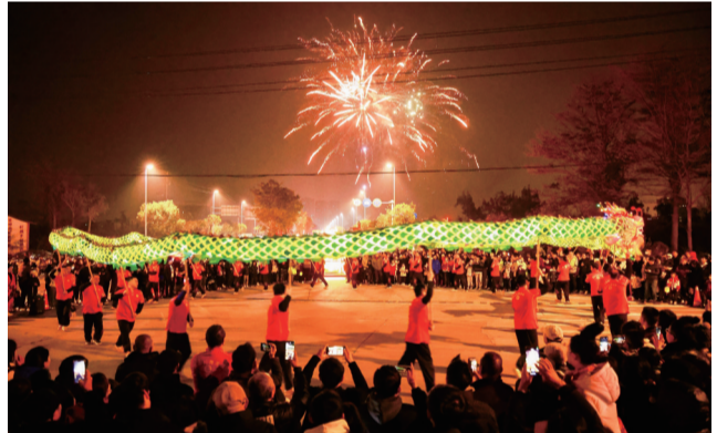
元宵“上元灯展·诗谜盛会”