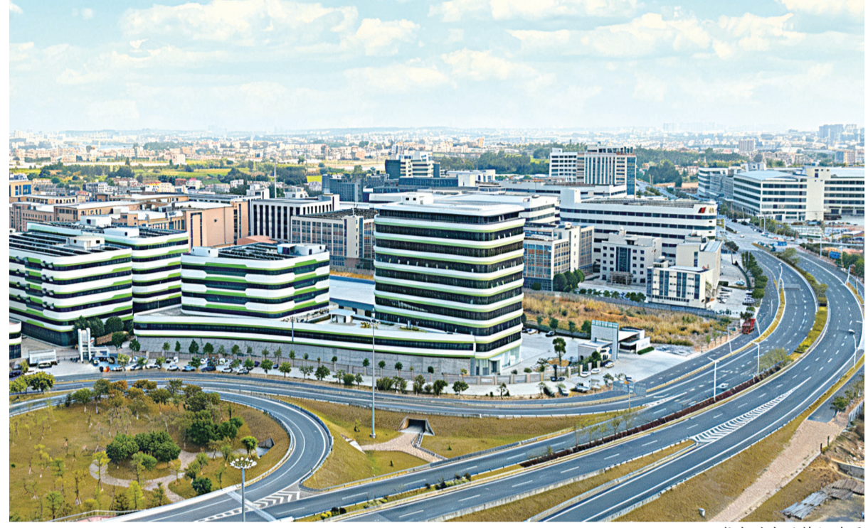
龙湖时尚服饰织造园

晋江市龙湖镇是“中国织造名镇”，这里既承载着传统产业的深厚积淀，又涌动着创新发展的时代活力。2025年，龙湖镇深学争优、敢为争先、实干争效，精准落实“1+6”专项攻坚行动，主要经济指标稳健增长：全年规上工业产值、限上批发业销售额、固定资产投资额分别比增2.18%、14.36%、22.95%，财政收入比增36%。产业转型升级步伐坚实，城乡品质显著提升，侨力反哺蔚然成风，“旅阅龙湖”文旅品牌知名度和影响力持续提升。 奋进之年，龙湖画卷正徐徐展开：一边是纺织智造园区内，自动化生产线高速运转，智能小车穿梭有序，彰显着“中国织造名镇”的智造活力；另一边，福林古村“西区97号”艺术社区里，现代艺术展吸引游人驻足，古厝斑驳的墙面与先锋的艺术装置碰撞出独特火花。这一“动”一“静”，正是龙湖镇以产业升级、城乡融合、侨力人文“三大引擎”，驱动“产城人”深度融合的生动缩影。 起步即加速，开局即冲刺。2026年是“十五五”规划的开局之年，龙湖镇将全面贯彻落实晋江市党代会精神，牢牢把握纳入泉州南翼国家高新区的战略机遇，坚持“创新发展‘晋江经验’”，围绕建设“‘产城人’深度融合织造名镇”这一核心目标，以深化拓展“1+6”专项行动为抓手，全力推动产业发展能级、城乡融合水平、民生幸福指数实现新跨越。