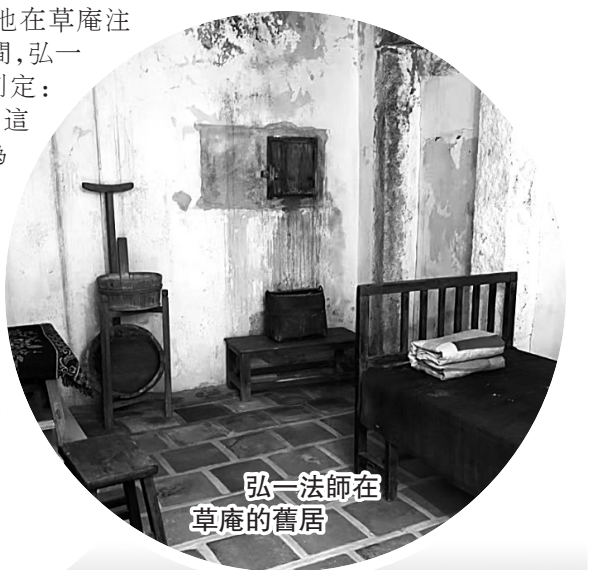
弘一法師在草庵的舊居