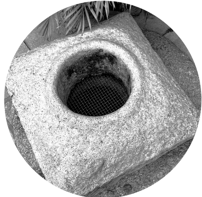
清淨寺裏的一口古井，井水澄澈可鑒。