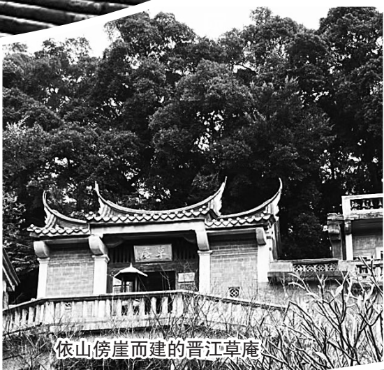
依山傍崖而建的晉江草庵