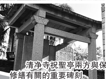
清淨寺祝聖亭兩方與保護修繕有關的重要碑刻