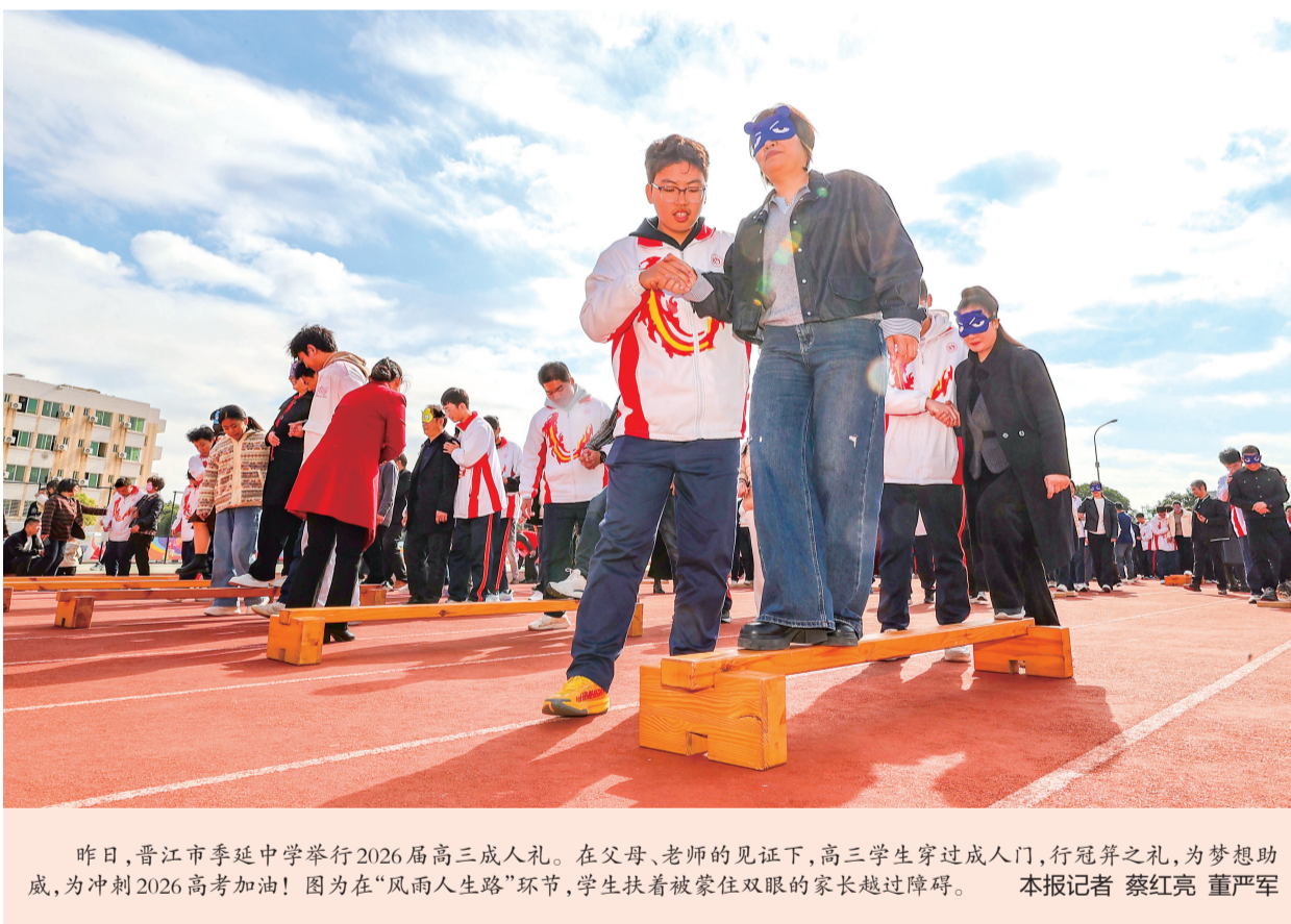
昨日，晋江市李延中举行2026届高三成人礼。在父母、老师的见证下，高三学生穿过成人门，行冠笄之礼，为梦想助威，为冲刺2026年高考加油！图为在“风雨人生路”环节，学生扶着被蒙住双眼的家长越过障碍。 本报记者 蔡红亮 董严军

系列活动以“街区玩味、古厝穿越、田园栖心、山野骑行、园区狂欢”为脉络，将全方位展现“海丝名城 活力晋江”的城市魅力。