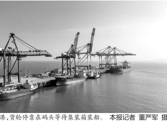
在晋江围头港,货轮停靠在码头等待集装箱装船。

分别增长9.1%和42.9%,这些正是晋江的支柱产业。 当前,随着全球经济重心的调整,金砖国家间的贸易与投资合作日益紧密,已成为推动全球经济增长的重要引擎。记者了解到,为助力企业抢抓金砖贸易机遇,泉州海关持续推进“提前申报”“抵港直装”等通关便利化改革,同时引导企业用足减免税、AEO高级认证等惠企政策。 “接下来,晋江将继续依托产业集群优势,推动更多‘晋江优品’深耕金砖市场,为泉州外贸稳量提质注入更强劲动能。”晋江市商务局相关负责人表示。