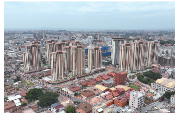
英林镇镇区更新改造工程安置房瑞英苑项目

蓝图已绘就，奋进正当时。站在新起点，英林镇将携手海内外乡贤，不断创新发展“晋江经验”，全面推进“产业强镇、商贸重镇、公益名镇、善治小镇、宜居福镇”建设，坚决扛起责任，实干担当有为，坚持链式思维抓产业，扎实推动城镇蝶变升级，以更高标准打造乡村振兴“英林样板”，用心用情办好民生实事，切实把一项项惠民利民的政策举措转化为一件件可观可感的民生成果，共同谱写中国式现代化县域实践的英林新篇章。