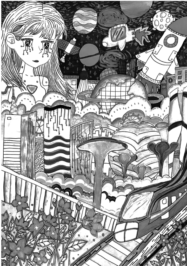
杨紫涵(育德小学六年3班) 指导老师 许玉莹