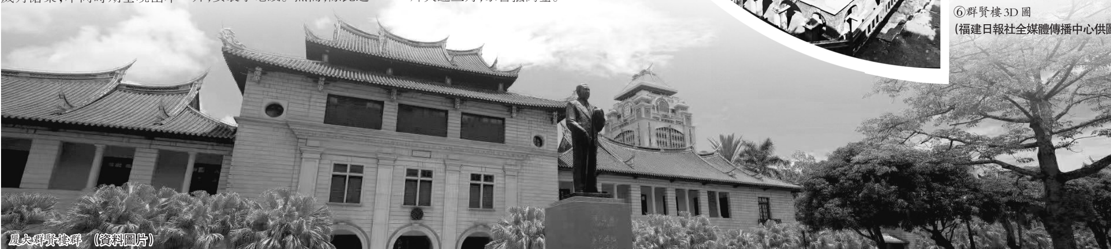
廈大群賢樓群 (資料圖片)