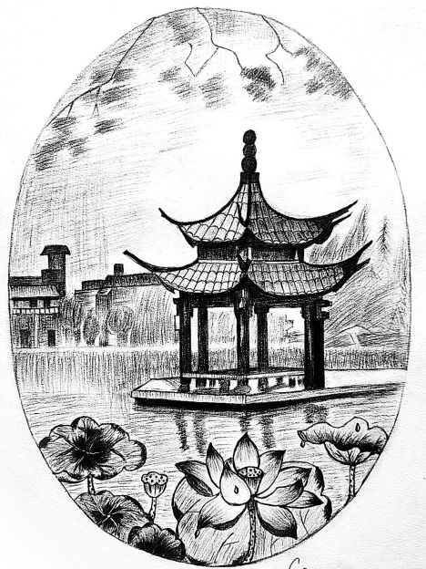
素描作品:《小城公园》 作者:欧阳玉帛(女,1967年生)