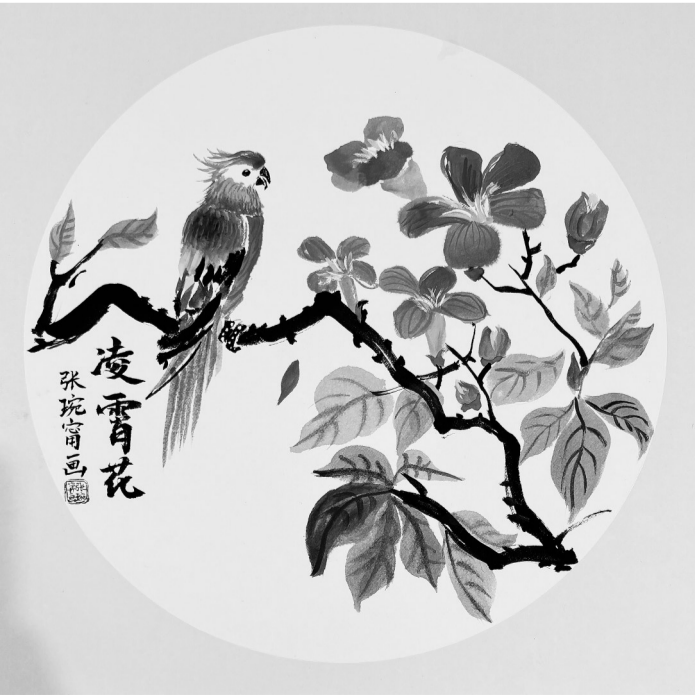
张婉甯（晋江安海养正中心小学四年7班） 指导老师 许雅幼