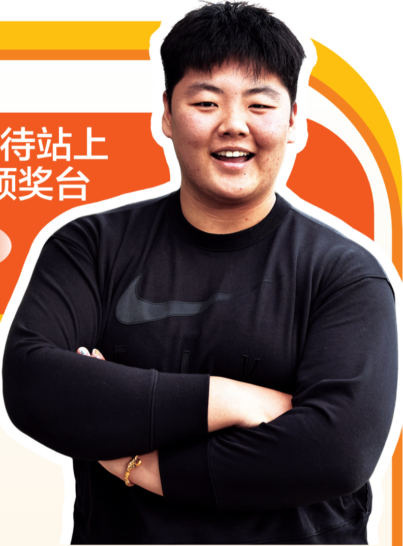
张家乐在摩纳哥蒙特卡洛留影。

新华社蒙特卡洛11月30日电 2025年度世界田联颁奖典礼11月30日在摩纳哥举行，中国链球运动员张家乐当选年度女子希望之星。她对新华社记者表示，中国女子链球在连续多届奥运会都有奖牌，但一直缺少一块金牌，希望自己未来能够站上最高领奖台。