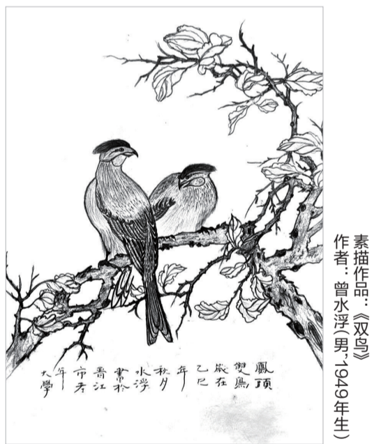
素描作品：《双鸟》 作者：曾水浮男(1949年生)