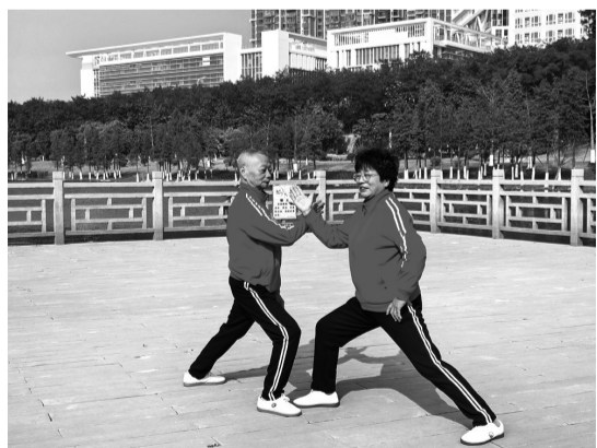
摄影作品：《太极伉俪》 作者：蔡春珍(女，1966年生)