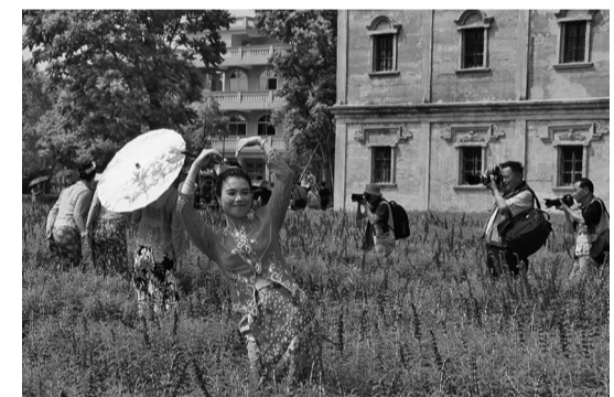
摄影作品：《梧林之花》 作者：蔡榕（女，1957年生）