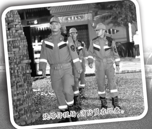
烧塔仔现场,消防员在巡查。

未来,这座浸润着千年文脉的古镇,必将继续以民俗为魂、以文旅为翼,在守护传统中创新,在传递“平安”期许中赋能发展,让更多人循着中秋的月色与热闹,走进安平、爱上安平,也让安海的文化名片在新时代愈发鲜亮,经济活力在传统与现代的交融中持续迸发。