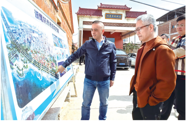
英林镇“强村发展日”观摩团走进湖尾村。

的经验分享，还是“引进来”榜样力量的传递，都营造出互学互鉴、共谋发展的学习氛围，为英