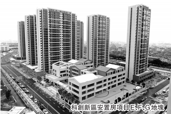
科創新區安置房項目E、F、G地塊

據了解，科創新區安置房共有A、B、C、D、E、F、G等7個地塊，其中6個地塊皆由晉江