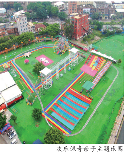
欢乐佩奇亲子主题乐园

此外,西园街道综治协会将继续发挥好桥梁纽带作用,进一步畅通沟通联系渠道,确保综治工作措施落到实处,推动形成邻里守望相助、家庭温暖和睦、乡村共富共美的社会新风尚,助力平安西园建设,赋能乡村全面振兴。