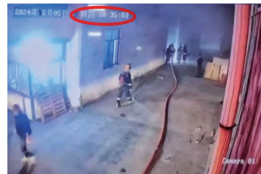
火灾扑救现场的公共视频截图。

本报讯(记者 朱艳)日前,内坑镇土垵村一企业车间遭遇突发火灾,由于员工迅速、准确的应急反应,以及“教科书”式的扑救,火势在短短15分钟内被成功控制,有效避免了人员伤亡和更大的财产损失。