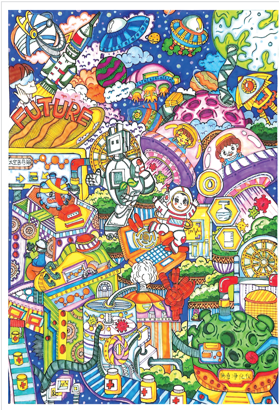
颜瑾(晋江安海西边小学六年2班) 指导老师 尤培玉

尝张骞出使西域为我们带来的美食……但我最想乘坐时光穿梭机去20年后的未来。我想去找一找20年后的自己,看看我有没有为了工作而努力?可能我经历了许多的困难和挫折,但我一定会告诉未来的我要勇敢面对,因为现在的我也在努力着。我知道成为一名真正的发明家并不容易,但我一定会继续努力学习,提高自己的动手能力和创新能力,不断探索和实践。加油!