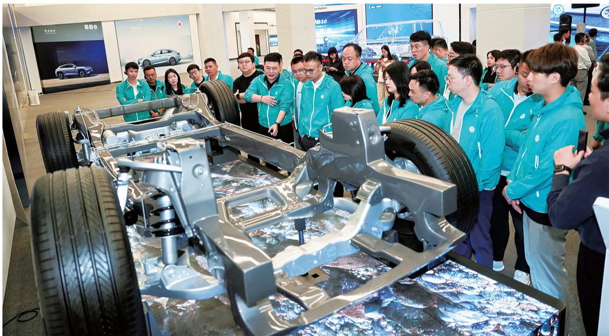
晋江青商观察比亚迪新能源汽车的底盘技术构造。

本报讯(记者 柯国笠)日前,晋江青商会“青商财俊”培训班大湾区行接二连三走进海能达、比亚迪、亚马逊、深圳大学及晋江市湾区创意创新创新中心,向“新”求智,帮助青商学员进一步提升企业科技创新、智能化管理水平。