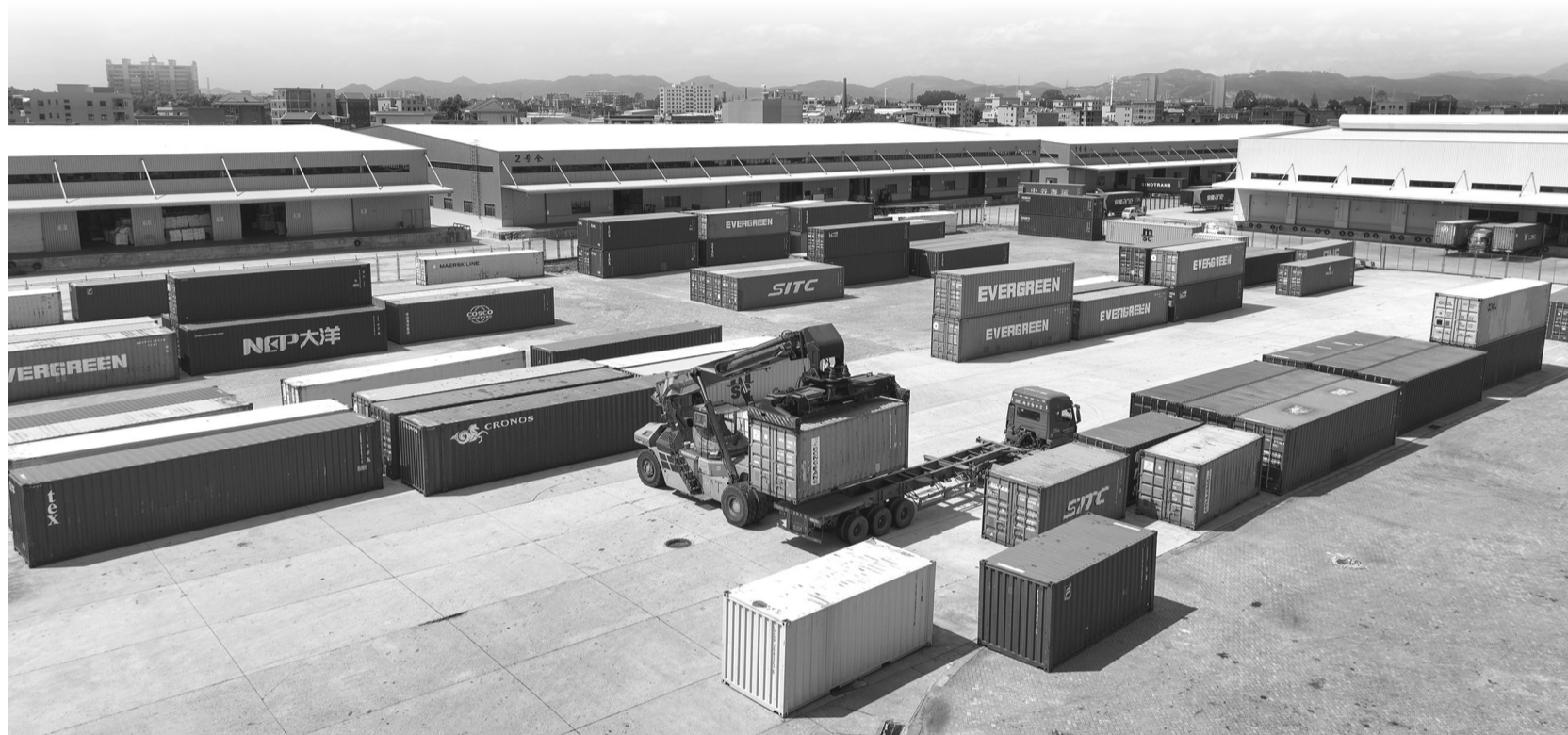
在晋江陆地港的国际陆港口岸海关监管堆场，港口集装箱吊运机在作业。

近年来，面对一波波房地产投资热，晋江党委和政府不盲目跟风，坚持不懈强实业。以2023年为例，晋江房地产业增加值占地区生产总值比重3.6%、三产比重8.9%，而其第二产业占GDP比重达58.5%。