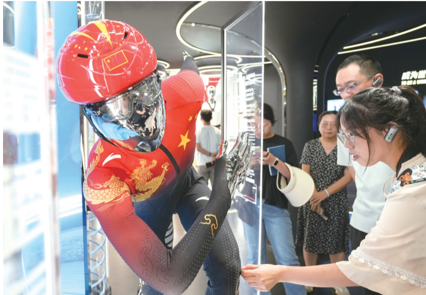
安踏博物馆里,高科技运动服吸引了众多参观者驻足欣赏。

略的20余项配套政策措施,“1+N”政策体系基本形成。建立了领导干部挂钩联系重点民营企业等工作机制,出台规范政商交往行为意见,修改废止了797件涉营经济法规、规章和规范性文件,上线全省一体化大融合行政执法平台。