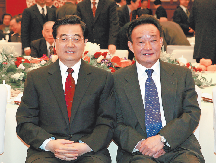
2005年1月1日,全国政协在北京举行新年茶话会。这是胡锦涛同志与吴邦国同志在一起。