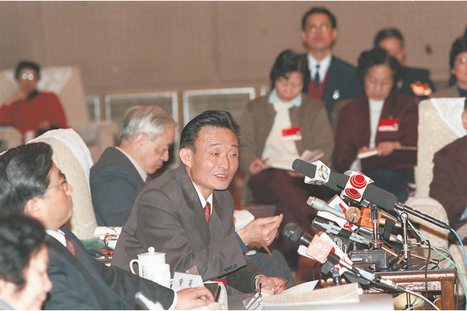
1994年3月,时任上海市委书记的吴邦国同志在全国两会上海代表团全团会议上。