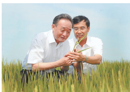
2012年7月19日,吴邦国同志在黑龙江农垦建三江管理局万亩水稻农场万亩地号察看水稻长势。