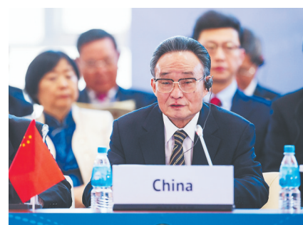
2013年1月28日,吴邦国同志在俄罗斯符拉迪沃斯托克出席亚太经合组织第21届年会,并作题为《坚持和平发展 促进合作共赢》的主旨发言。