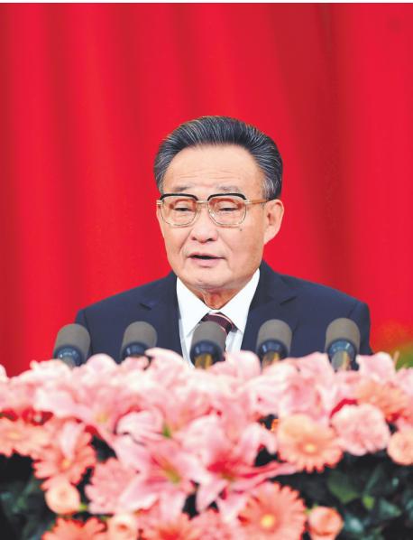
二〇一一年三月十日,十一届全国人大四次会议在北京人民大会堂举行第二次全体会议。吴邦国同志作全国人大常委会工作报告。