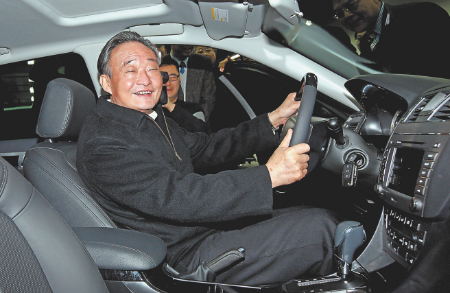
2010年1月30日,吴邦国同志在上海汽车集团股份有限公司技术中心察看新能源样车。