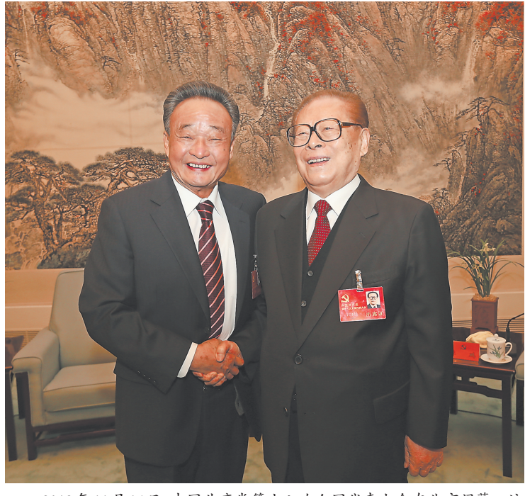
2012年11月14日,中国共产党第十八次全国代表大会在北京闭幕。这是闭幕会前,江泽民同志与吴邦国同志在一起。