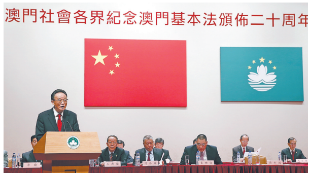
2013年2月21日,吴邦国同志在澳门文化中心出席澳门社会各界纪念澳门基本法颁布20周年启动大会并发表讲话。