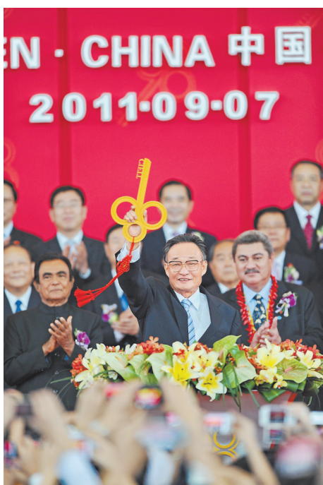
2011年9月7日,吴邦国同志在福建厦门出席第十五届中国国际投资贸易洽谈会开幕式。