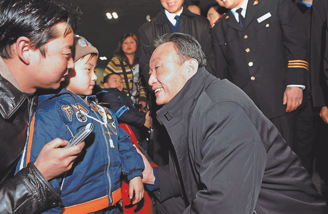
2008年2月3日,吴邦国同志在北京西站候车室与旅客交谈。