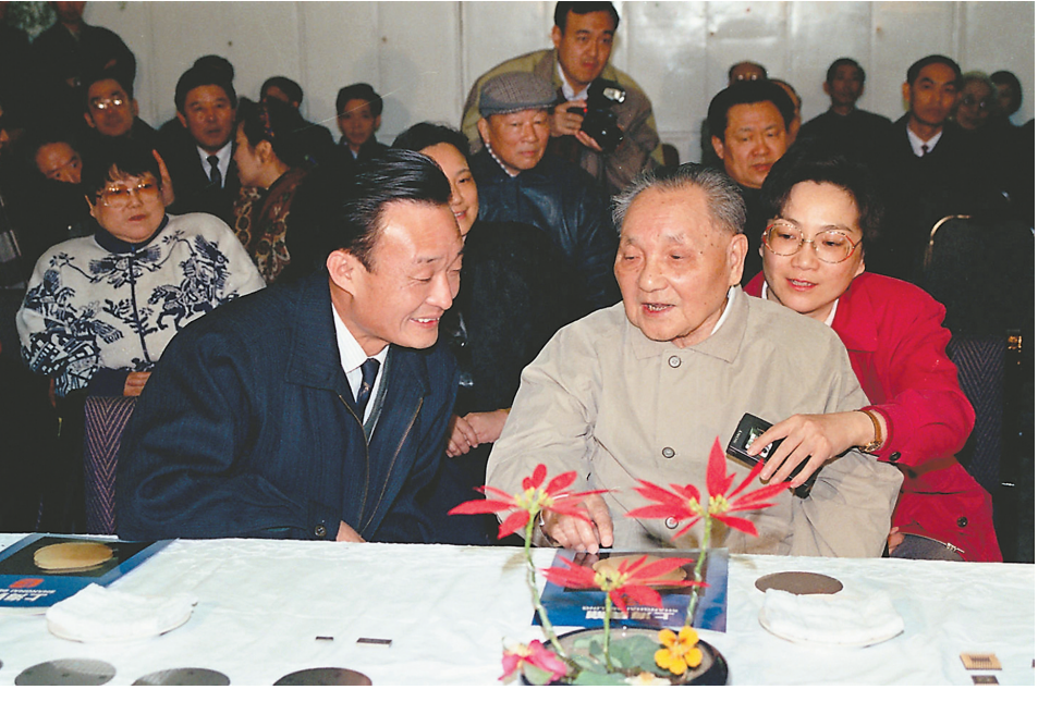
1992年2月10日,邓小平同志在上海贝岭微电子制造有限公司参观时与吴邦国同志交谈。