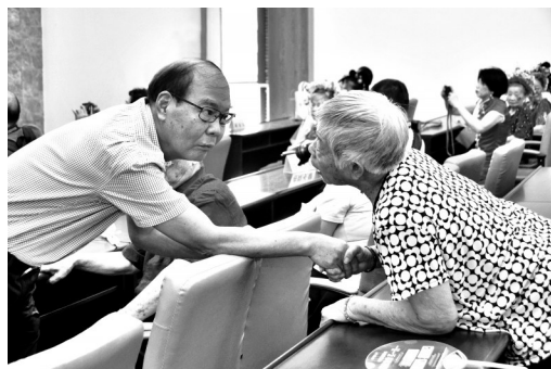
摄影作品:《倾听》 作者:黄清淳(男,1954年生)