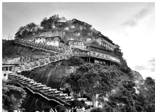
摄影作品:《仙境如斯》 作者:蔡彩雪(女,1951年生)