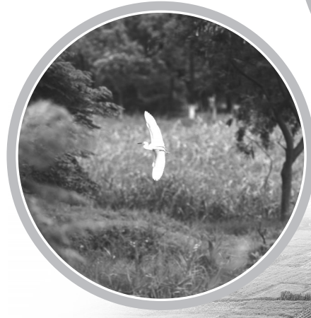
安海湾绿道“一线串珠”,形成乡村游精品线路。