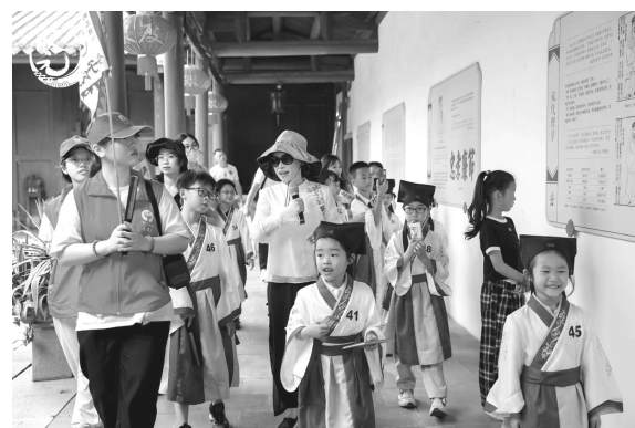
“古镇状元游·亲子徒步”活动,孩子们沉浸式“穿越”。

安平桥景区建设是安海推动全域旅游的典范,也是安海依托生态资源优势,推动生态价值实现的生动样本。除此之外,安海镇还深入开展城乡环境综合整治,常态化开展人居环境整治,大力推进厕所革命、污水管网、垃圾分类、河道整治等农村人居环境重点项目建设。同时,积极健全环境保护监管机制,落实河湖长制、“河长+警长”“林长+警长”等工作机制,通过不断优化城乡环境,助推全域旅游发展。