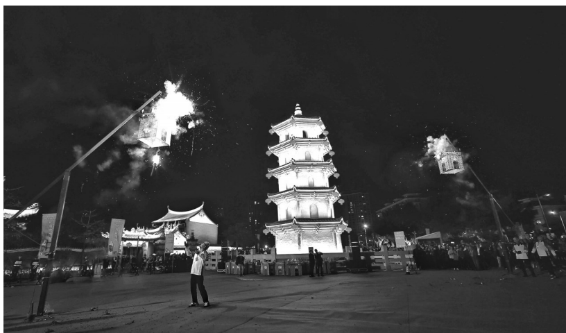
安海闹元宵,白塔下欢乐攻炮城。

文化是旅游的灵魂,旅游是文化的载体。近年来,安海镇持续挖掘深厚的历史文化积淀,积极策划文旅项目、打造文旅路线,推动文化和旅游相生共荣、融合交汇。