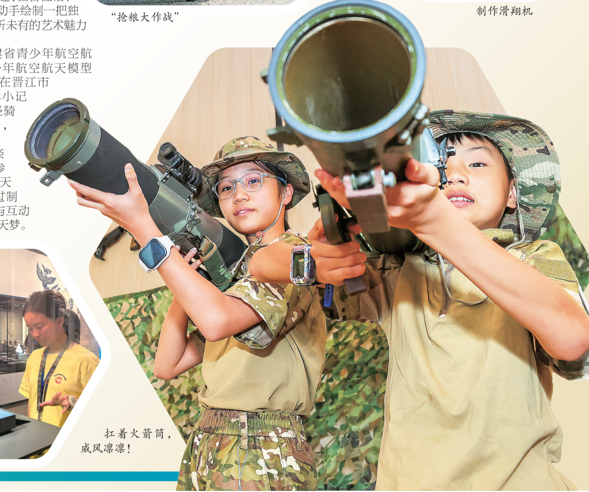
扛着火箭筒,威风凛凛!