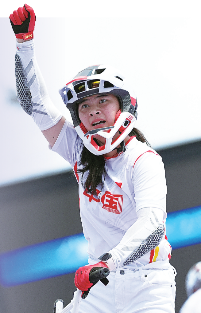
昨日,在巴黎奥运会自由式小轮车女子公园赛决赛中,中国选手邓雅文获得冠军。图为邓雅文在赛后庆祝。