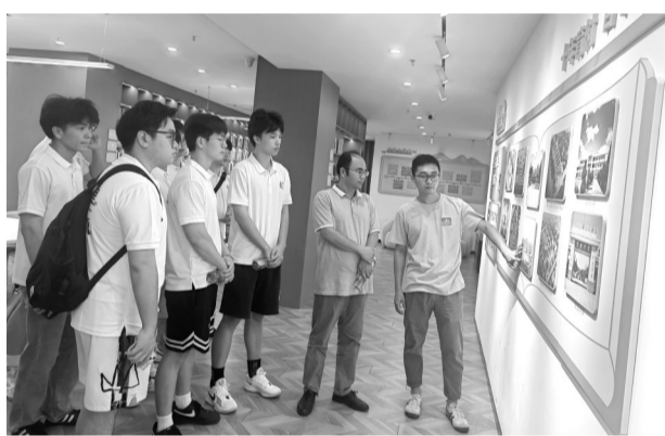
莆田学院商学院社会实践队成员在罗山街道山仔社区“党建+”邻里中心开展社会实践活动。