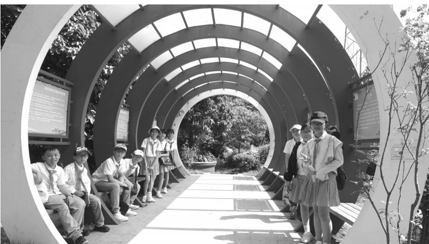
摄影作品：《时空少年》 作者：蔡尤成男（1951年生）

书法、绘画、摄影、诗词、剪纸……如果你喜欢这些、擅长这些，那么，这里便是你展示的舞台。“才艺秀场”作为展示老年朋友才艺作品的平台，长期面向全市老年朋友征集优秀作品。