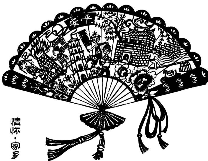
剪纸作品：《印象安海》 作者：许海英（女，1968年生）