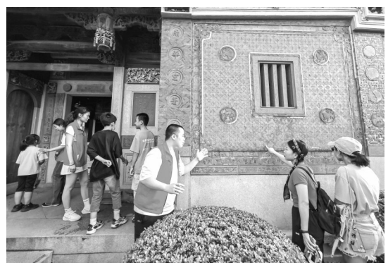
晉江籍大學生(右三)向游客講述古厝歷史。

據了解,此次講解是晉江大學生自發的公益活動,以“紅磚古韻承文脈,晉江智慧助騰飛”為主題,連續5天在五店市傳統街區朝北大厝開展,旨在推廣家鄉文化。