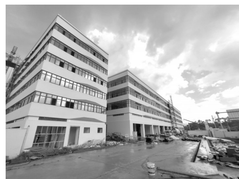
新天物流項目現場

西園街道相關負責人表示,西園將用好城西片區資源稟賦,全力以赴奮戰“項目創優年”,縱深推進“1+6”專項行動。2024年,西園街道共策劃葫蘆山文教園區、健康產業園、德志物流園、新天物流、展志物流園、萬貫倉儲、耀中物流等35個重點項目,年度投資36.26億元。為加快項目落地投產,街道組建工作專班,結合重點項目“幫代辦”機制,安排專人跟蹤、靠前服務,力促開工項目早日投產、未開工項目如期推進,全力推進“生態宜居西城區,現代服務業新高地”建設。