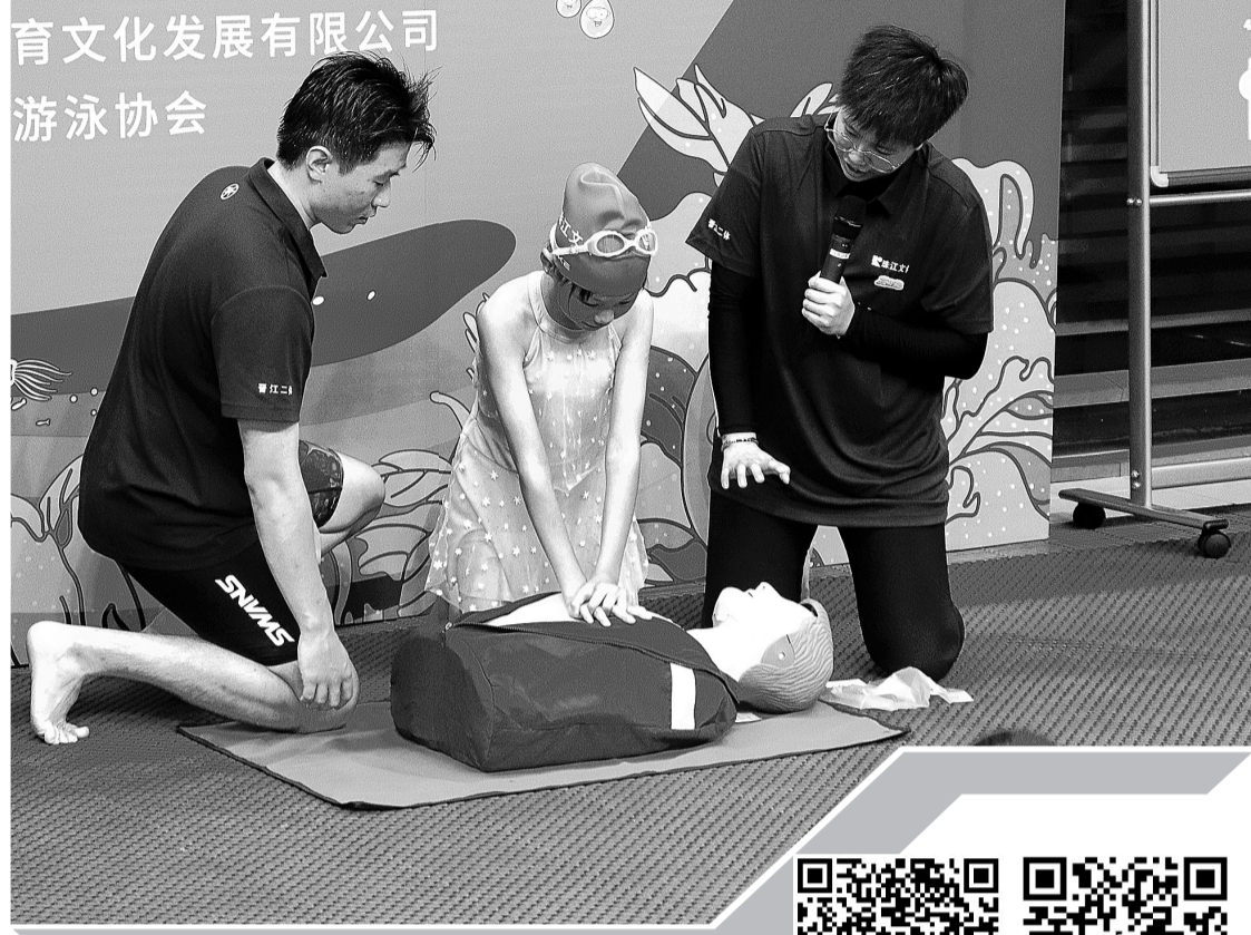
晋江学生学习心肺复苏术。

暑假期间，晋江不少学校还定时推送防溺水线上讲座等资源包，并鼓励学生通过手抄报、绘画、征文等方式，学习防溺水知识，小手拉大手，做到安全“不放假”。