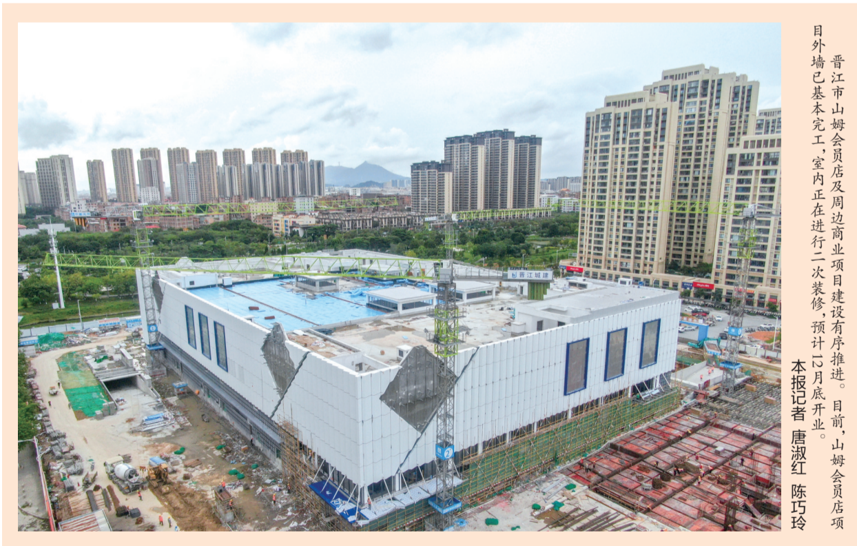
晋江市山姆会员店及周边商业项目建设有序推进。目前，山姆会员店项目外墙已基本完工，室内正在进行二次装修，预计10月底开业。本报记者 唐淑红 陈巧玲

会议强调，要学纪在前，以党纪学习教育为契机，严守政治纪律和政治规矩，始终做政治上的明白人、老实人。要知纪明责，坚持遵规守纪与敢做善为相统一，自觉用党章党规党纪约束自己，牢固树立和践行正确政绩观，正确处理好政商交往关系，以更加奋发有为的精神状态抓发展、干事业。要守纪力行，以身作则，以上率下，清清白白做人、干干净净干事、一尘不染从政，做好政治生态的引领者、营造者、维护者。